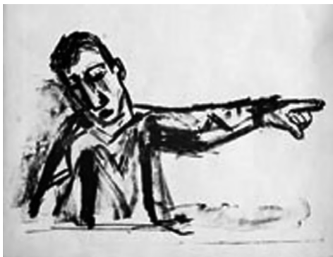
ILLUSTRATIE: OTTO DIX